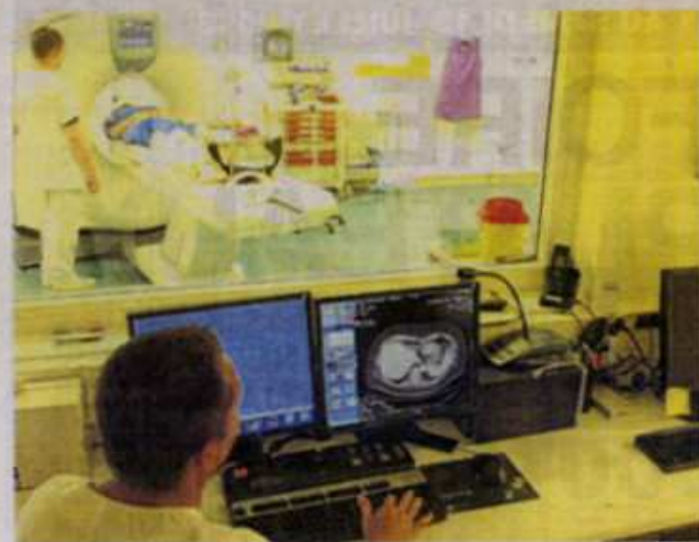
Les images transmises en direct sur ordinateur.

L'arrivée de ce matériel performant au sein du Chic est un plus formidable pour l'établissement. Il ne reste qu'à espérer qu'il y ait toujours un nombre suffisant de personnel pour l'utiliser.